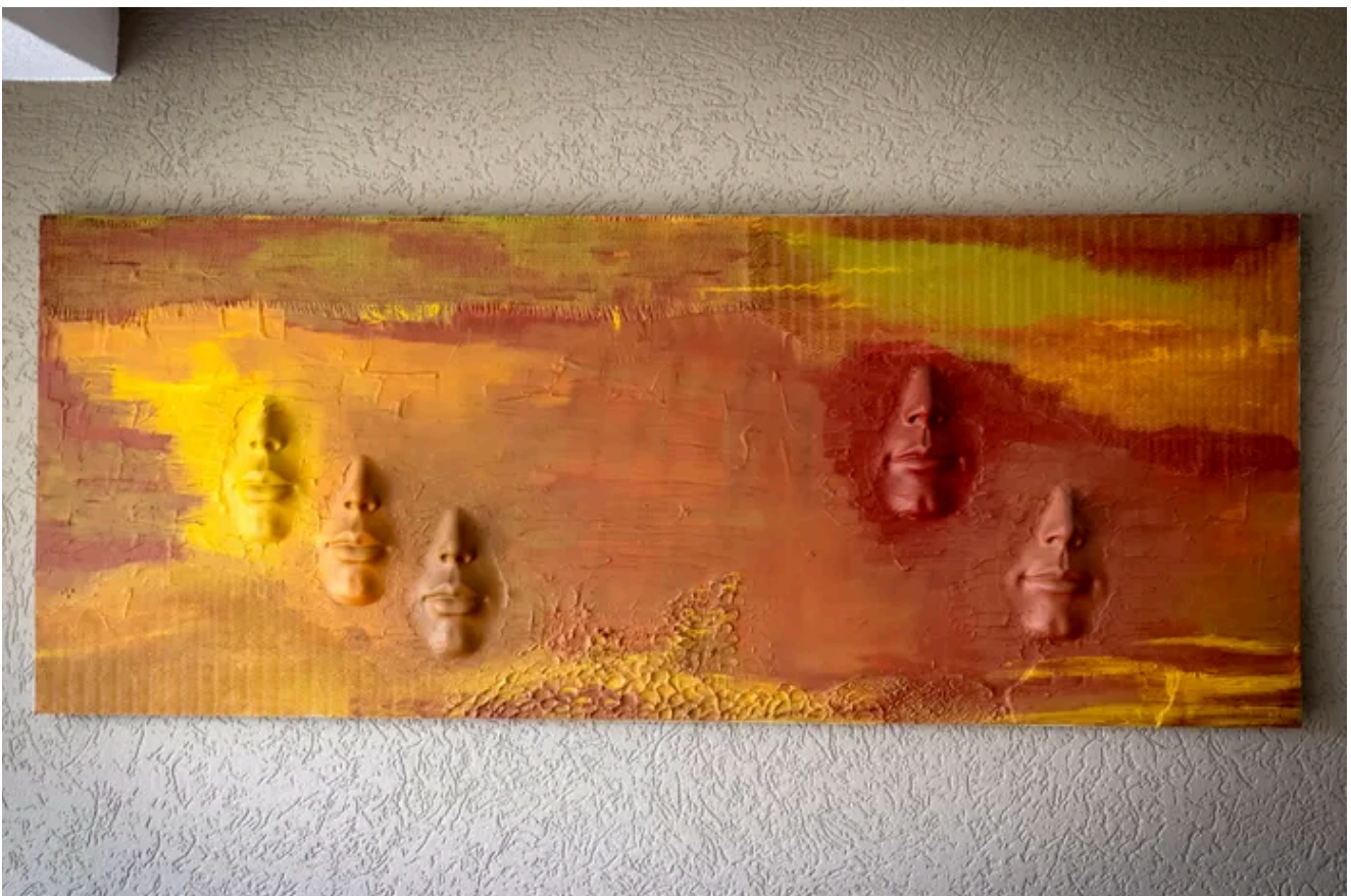
Een van haar vele schilderijen heeft een plekje gekregen aan de wand. © Robin Hilberink

De kunst van Hermine is te zien op mijnkunst-mijnleven.nl .